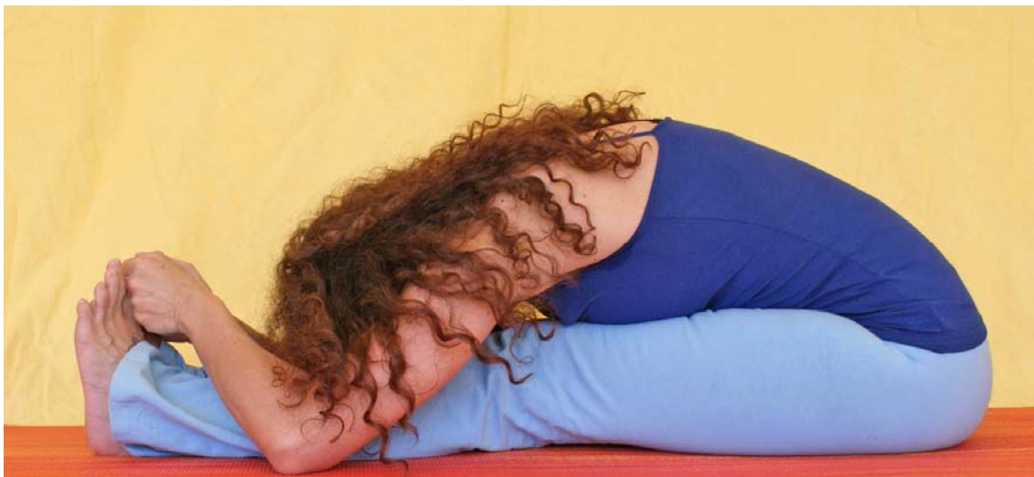
Abbildungen 7 und 8

Der vollständige Drehsitz ist allerdings recht schwierig. Wer ihn in Angriff nehmen will, muss zuerst den Lotossitz vollständig meistern, das heisst eine sehr grosse Beweglichkeit im Knie und Fussgelenk entwickeln. Weiterhin ist die Stellung nur möglich, wenn keinerlei Bauchfett im Weg ist.